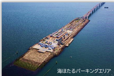
海ほたるパーキングエリア