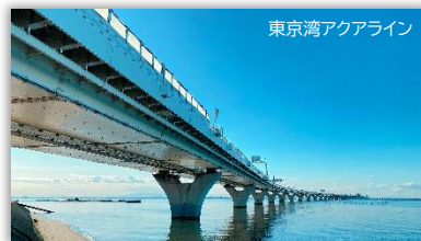
東京湾アクアライン

東京湾を横断する全長15.1kmの自動車専用道路。周囲を海と空に囲まれた一面青いパノラマビューをお楽しみください！