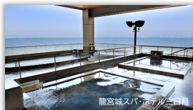
龍宮城スパ・ホテル三日月