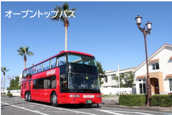
オープントップバス