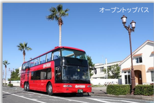
オープントップバス

木更津駅～海ほたるパーキングエリアを往復するオープントップバスを限定運行します！！